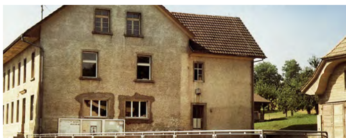
Altes Schulhaus (erbaut 1854)

«heimelig», wenn im ersten Stock eine Versammlung oder ähnliches stattfindet und ich unten im Büro die Geräusche von Aktivität und Leben mitbekomme. Könnten die Mauern unseres Gemeindehauses sprechen, hätten sie einiges über die Geschichte von Walterswil zu erzählen – über freudige und sonnige Momente – aber auch über Trauer und Leid.