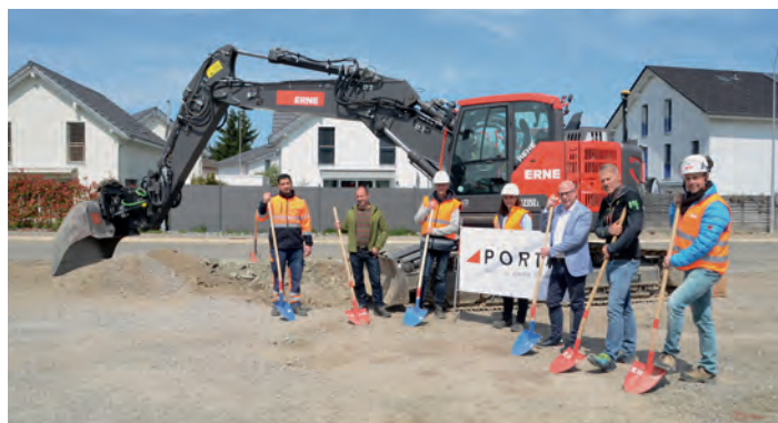
(Foto Spatenstich/Quelle Foto: Lilly-Anne Brugger/Zofinger Tagblatt)

Die Bauarbeiten für das Regenüberlaufbecken haben Ende April gestartet. Aufgrund des Baustellenverkehrs wurde auf der Mööslistrasse die Höchstgeschwindigkeit auf 30 km/h reduziert.